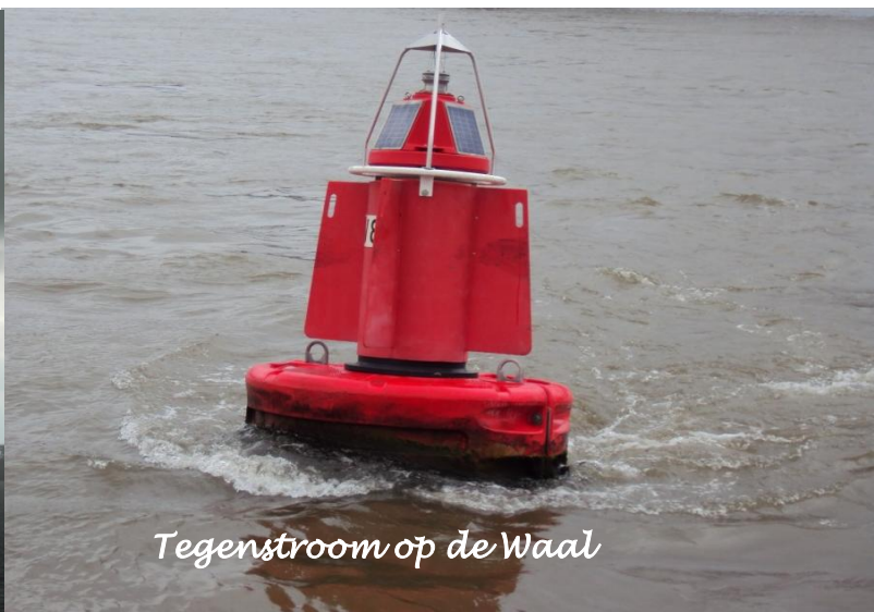
Tegenstroom op de Waal