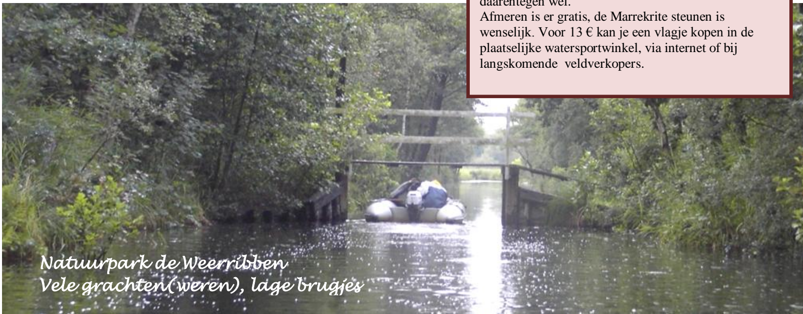
Natuurpark de Weerribben Vele grachten(weren), lage brugjes

Afmeren is er gratis, de Marrekrite steunen is wenselijk. Voor 13 € kan je een vlagje kopen in de plaatselijke watersportwinkel, via internet of bij langskomende veldverkopers.