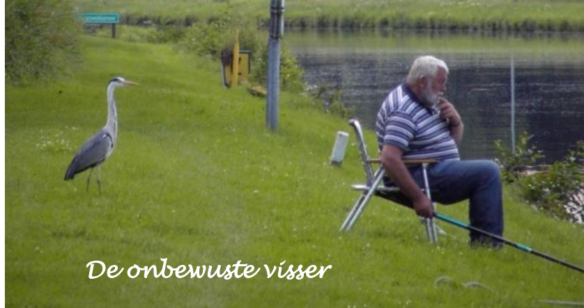
De onbewuste visser