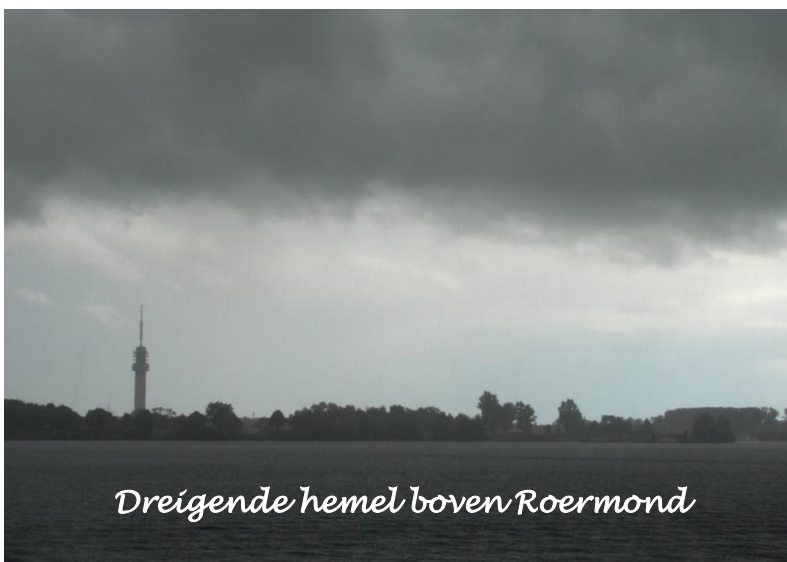
Dreigende hemel boven Roermond

Vr 13 juli: Boodschappen doen bij ‘Twee Gebroeders van Venlo’. Deze avond staan er asperges à la Flamande op het menu, mmm, lekker! De watertank nog bijvullen en verder stomen tot het Leukermeer. Ooit lagen we hier, omwille van geen plaats meer vrij, voor anker. Vandaag is dit niet nodig, plaats zat. Om te zwemmen is het nog iets te koud maar het zonnetje komt regelmatig achter de wolken piepen.