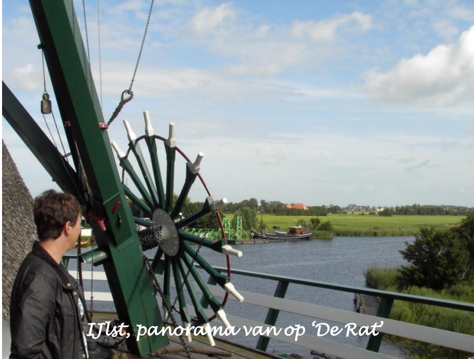
IJlst, panorama van op 'De Rat'

Met zoveel grachten om je heen is het ook niet verwonderlijk dat 'fierljeppen' hier als een deel van de opvoeding wordt beschouwd. Het komt erop aan om na een korte sprint de rechtstaande polsstok te grijpen, omhoog te klimmen en zo ver mogelijk over de sloot neer te komen. Op het plaatselijke sportveld zie je (bijna) alle leeftijden oefenen dat het een lieve lust is. Sommigen kunnen straks ongetwijfeld met een natte broek naar huis.