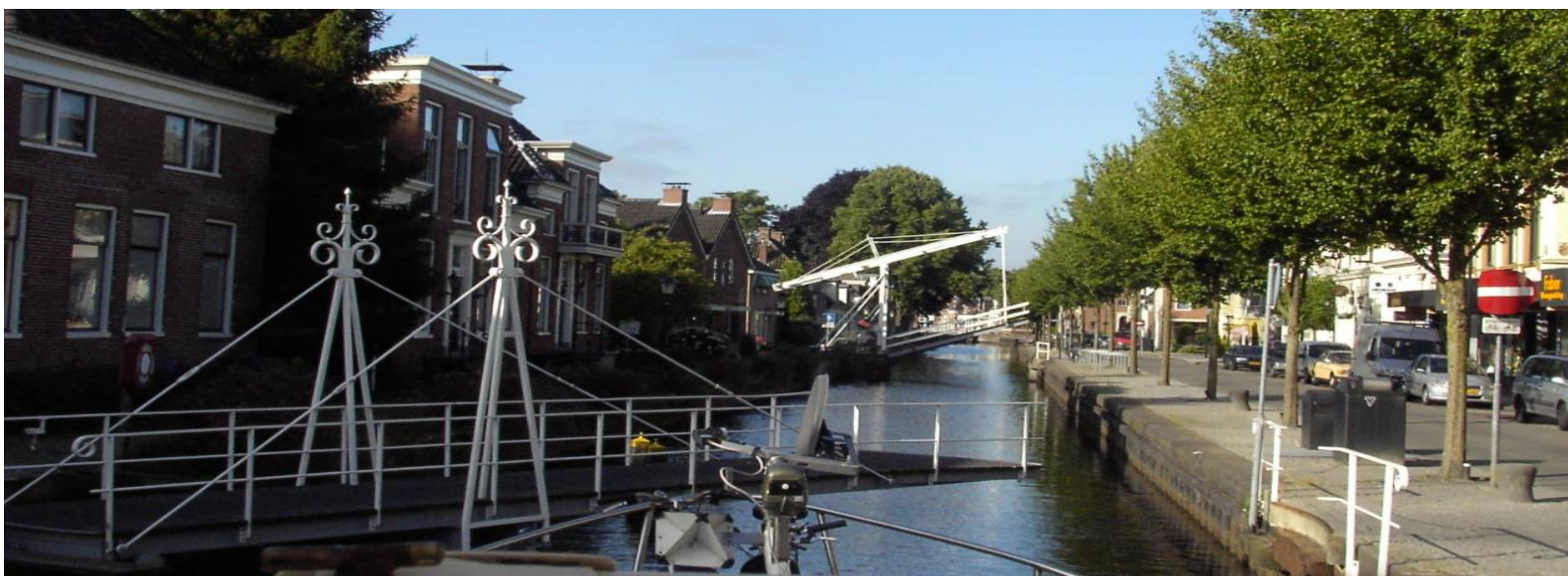
Veendam - Oosterdiep, een ketting van brugjes

Vr 27 juli: Afspraak met de brugbediener om 8 uur, da's vroeg, naar onze maatstaven toch. Voor de brave man blijkbaar ook. Met een half uurtje vertraging draait hij voor ons twee brugjes en geeft ons lot in handen van een volgende ploeg die stipt als de Big Ben om 9h30 de eerste draai geeft. De 36 brugjes (over een afstand van amper 10 km) volgen elkaar in sneltreintempo op.