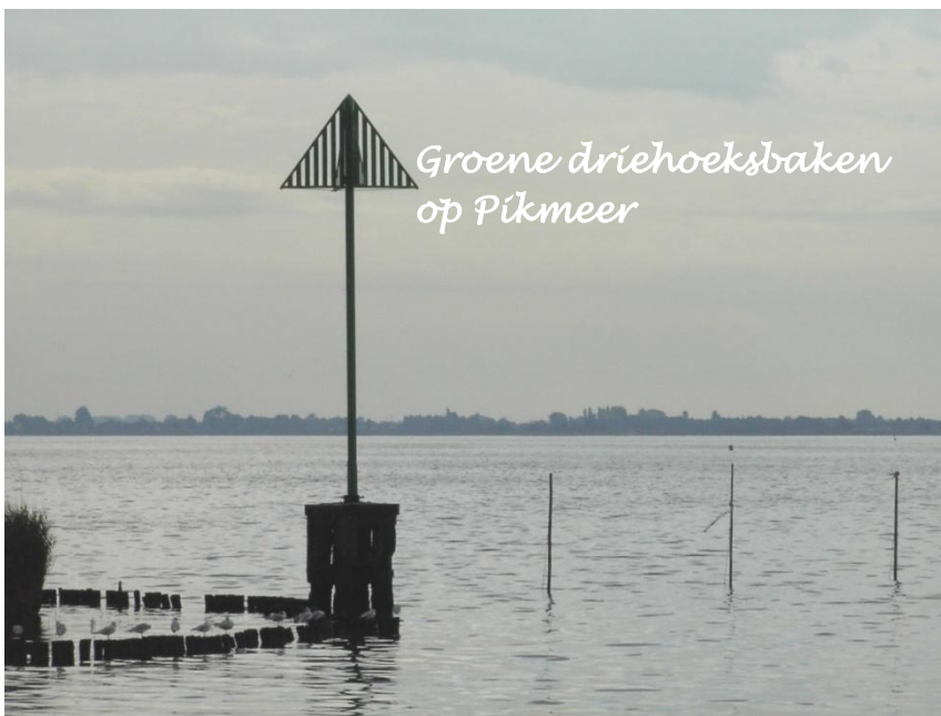
Groene driehoeksbaken op Pikmeer

Za 4 aug. : IJlst, ook één van de Friese elfsteden, heeft een mooie oude dorpskern, bijna centraal staat een grote fabrieksschouw van de vroegere firma Nooitgedagt, overblijfsel uit een glorieus verleden als centrum van de Friese schaatsenmakerij. Het dorp is doorgroefd met heel veel grachten en kanalen. Elk gezin heeft hier kennelijk minstens één vaartuig, meestal afgemeerd bij de achterdeur, die enkelingen zonder achterdeur raken hun bootje kwijt in een gemeenschappelijke afmeerplaats.