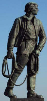
De Redder van Vlissingen

Vlissingen is echter wel meer dan een bezoek waard, al was het enkel om de reuzen van de zee van op de rede gade te slaan als ze gezwind de Westerschelde opdraaien terwijl de loodsbootjes op en af “vliegen” met hun kostbare vracht. Zowel op de promenade langs de stranden als in het centrum heerst een gezellige drukte.