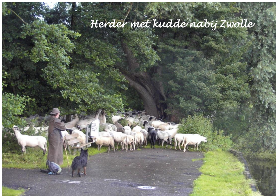
Herder met kudde nabij Zwolle

Onze vocabulaire is vandaag een woordje rijker: STEIGERSLET. De ietwat excentrieke havenmeesteres bedacht de naam voor haar zwangere hond die blijkbaar overal vriendjes heeft.