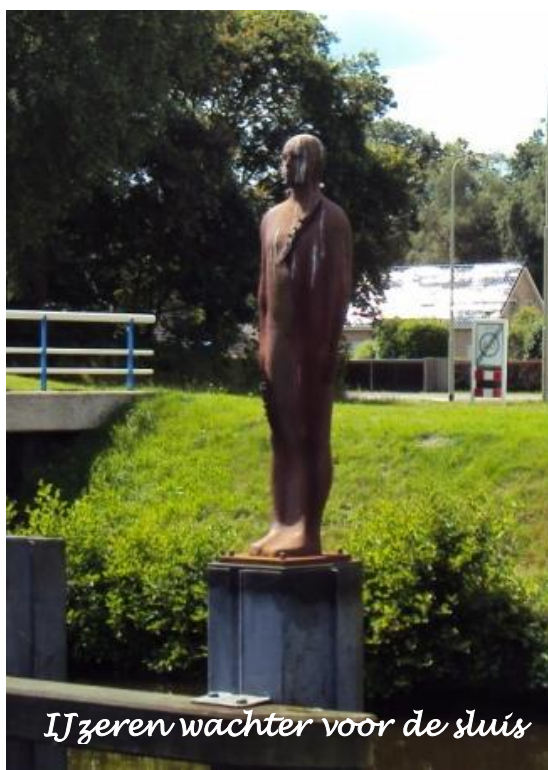
IJzeren wachter voor de sluis

Vr 20 juli: In Zwartsluis draaien we het Meppelerdiep op, tikken nog twee automatische reddingsvesten op de kop in solden en varen verder richting Drentsche hoofdvaart: kleine oude 18 de eeuwse sluisjes, handbediend, perfect onderhouden, zoals alles bij onze noorderburen. Vlotte en vriendelijke bediening. De 26 hefbrugjes komen in beweging van zodra je naderbij komt. Oproepen hoeft niet. Voorbij Meppel kom je geen beroepsvaart meer tegen. Regelmatig zijn gratis afmeermogelijkheden voorzien, doch, niet te laat afmeren is de boodschap. Voor fietsliefhebber die graag in de natuur vertoeven is deze streek waarschijnlijk de hemel, of toch zeker het vagevuur.